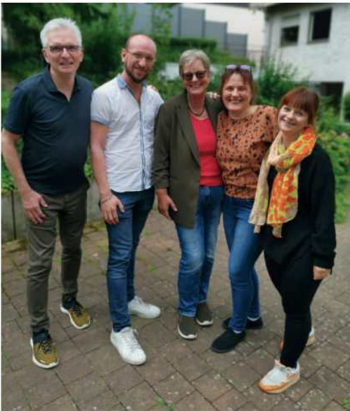
Team CHD Lebenshaus

"Kleine Schritte sind besser als keine Schritte" (Willy Brandt)